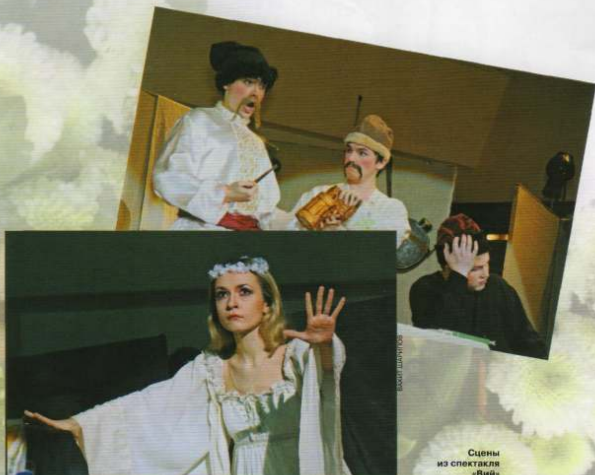
Сцены из спектакля «Вий»