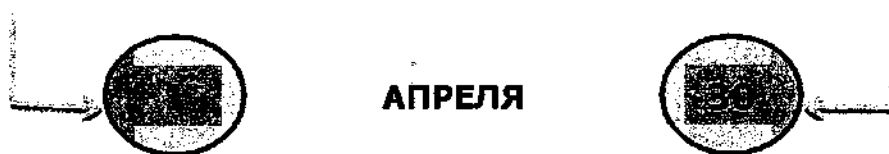
Схема 1. Представление сведений

федеральные государственные служащие, служащие ЦБ РФ, работники ПФР, ФСС РФ, Федерального фонда ОМС, государственных корпораций и др.