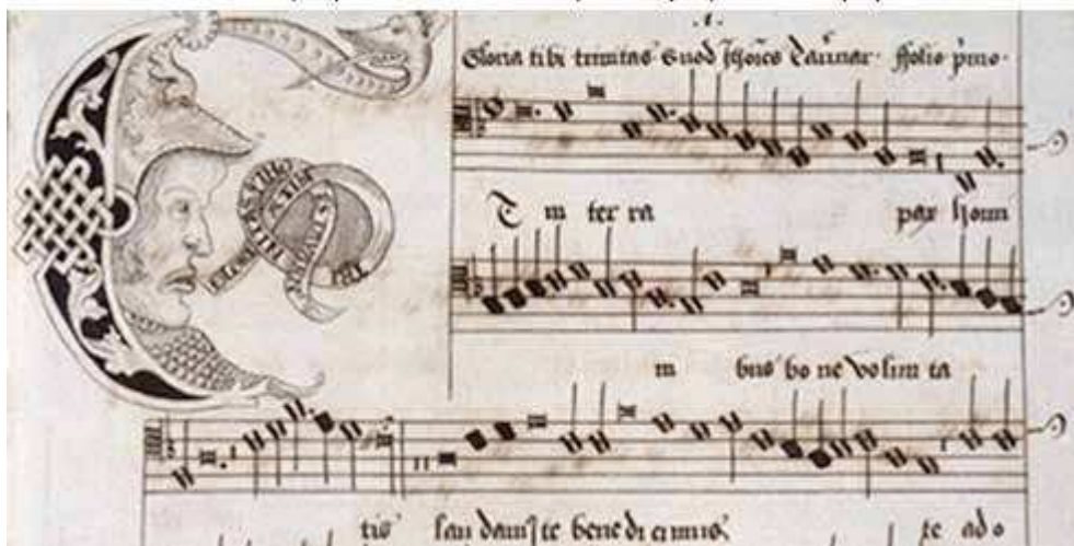
1 Изображение Джона Тавернера в начале мессы "Gloria tibi Trinitas" из манускрипта "Forrest-Heyster" (партия тенора)

Об этом периоде жизни Тавернера известно достаточно много благодаря сохранившейся документации Кардинал-колледжа, а также переписке связанных с деятельностью колледжа лиц. О Тавернере до его появления в Оксфорде существует мало документально подтвержденной информации. Достоверно известно, что в 1524 году он был приглашен в качестве певчего в церковь Св. Ботольфа в Бостоне 3 и получил за это денежное вознаграждение.